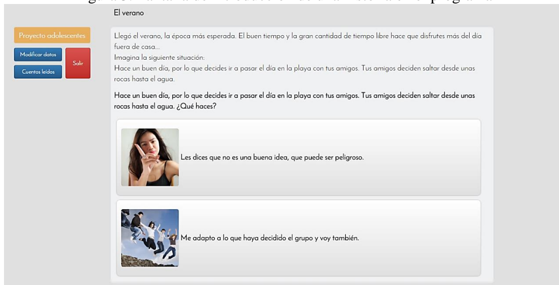
Figura 3. Pantalla de introducción de una historia en el programa

A continuación, a modo de ejemplo, se presentan algunas de las pantallas del programa, durante el desarrollo de las historias. En la figura 3, se presenta la introducción, que cumple la función de situar al jugador en el contexto donde se va a desarrollar la historia. En este caso, se proporciona información sobre lo que ocurrió antes de la situación que se presentará inmediatamente (ver figura 4), y donde el sujeto tendrá que elegir con sus respuestas, el desarrollo y desenlace de la misma.